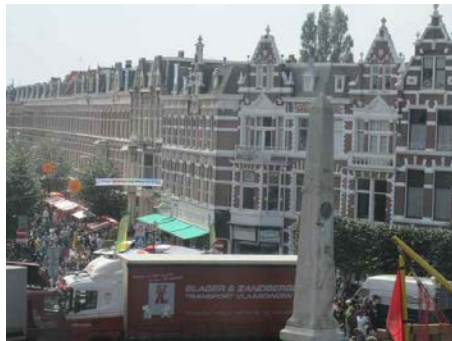
Het Zomerfestival 2010 trok ruim 8000 bezoekers

Voor wat betreft het grootschalige evenement is het ons doel de tweede editie van het “Weimarstraat Zomerfestival” te organiseren, dat het voorbije jaar met succes en positief werd ontvangen door de ondernemers.